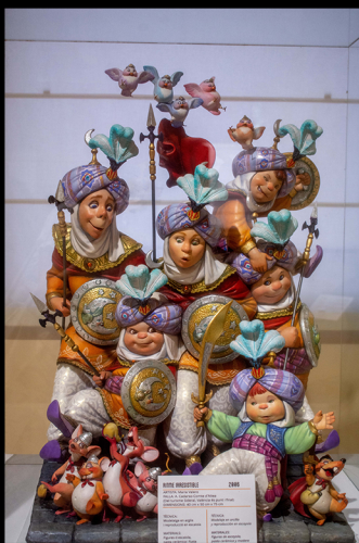
Muzeum Las Fallas

Oczywiście, oprócz praktyk w naszym grafiku znalazło się miejsce na plan kulturowy. W wolnym czasie zwiedzaliśmy najciekawsze miejsca w Walencji. Oto niektóre z nich.